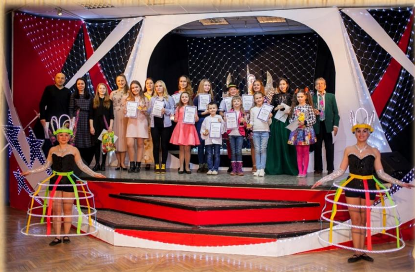
Конкурс исполнителей эстрадной песни «Звонкие голоса»