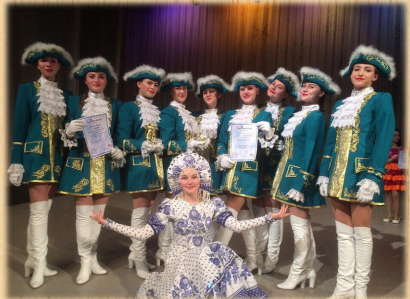
заслуженный коллектив РФ ансамбля танца «Фейерверк» на фестивале «Жемчужины России» г. Воронеж