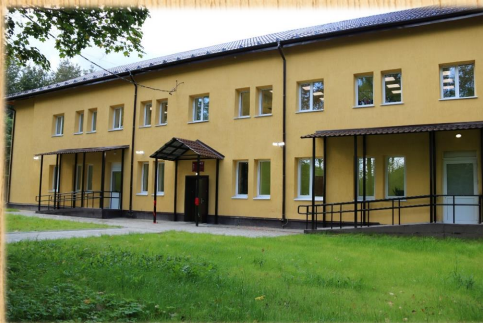
Назиевская детская школа искусств ПОСЛЕ ремонта