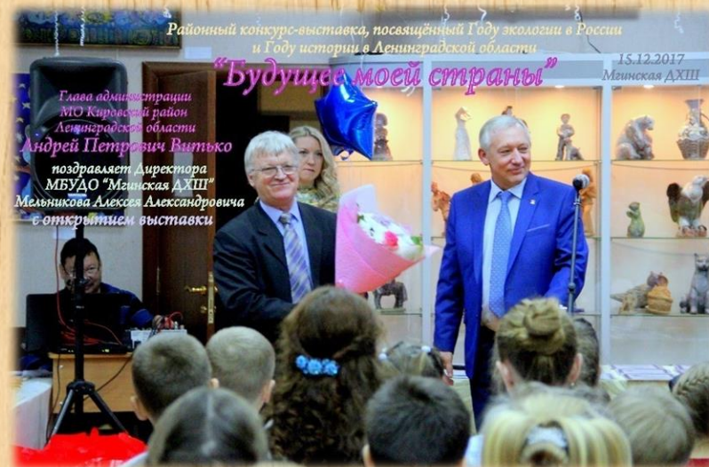
"Районный конкурс-выставка изобразительного искусства и декоративно- прикладного творчества "Будущее моей страны"