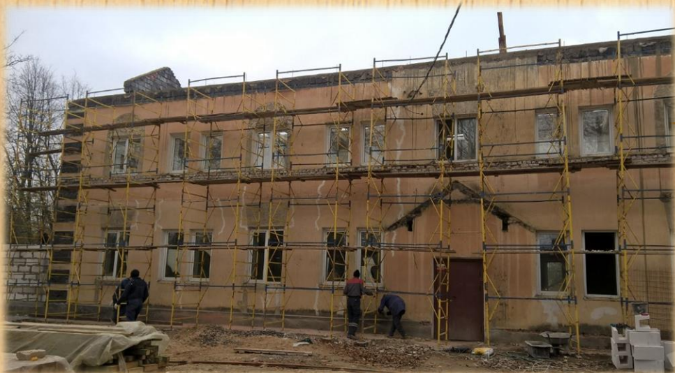
Назиевская детская школа искусств ДО ремонта