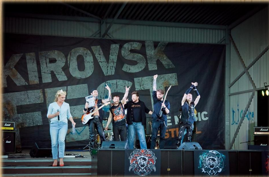
открытый фестиваль живой музыки «На Кировской волне»